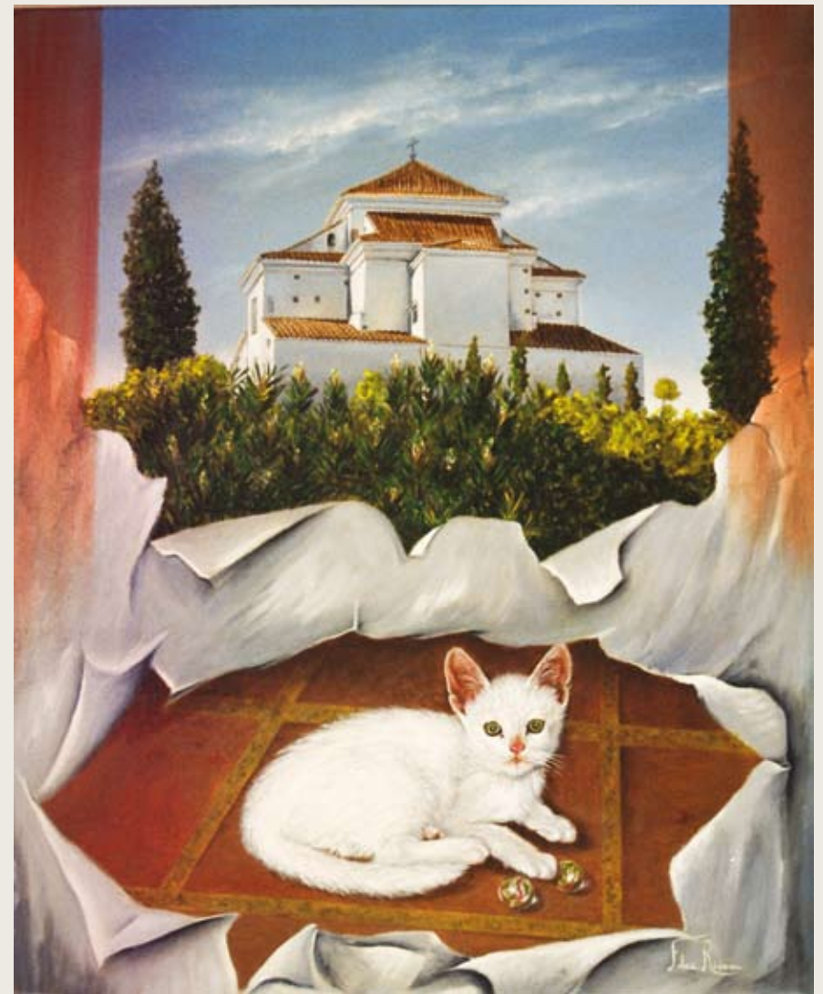
Un habitante en la Ermita