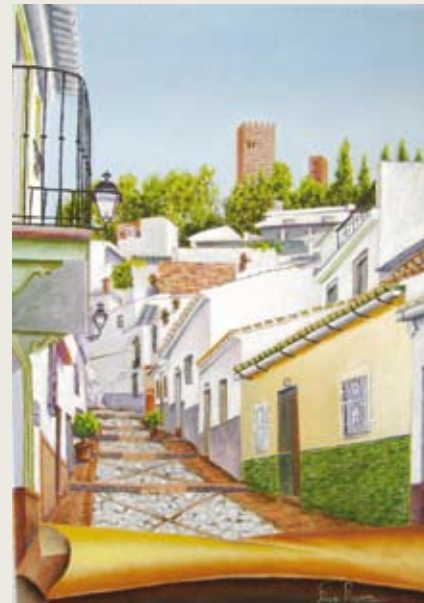
La casa de la Pintora