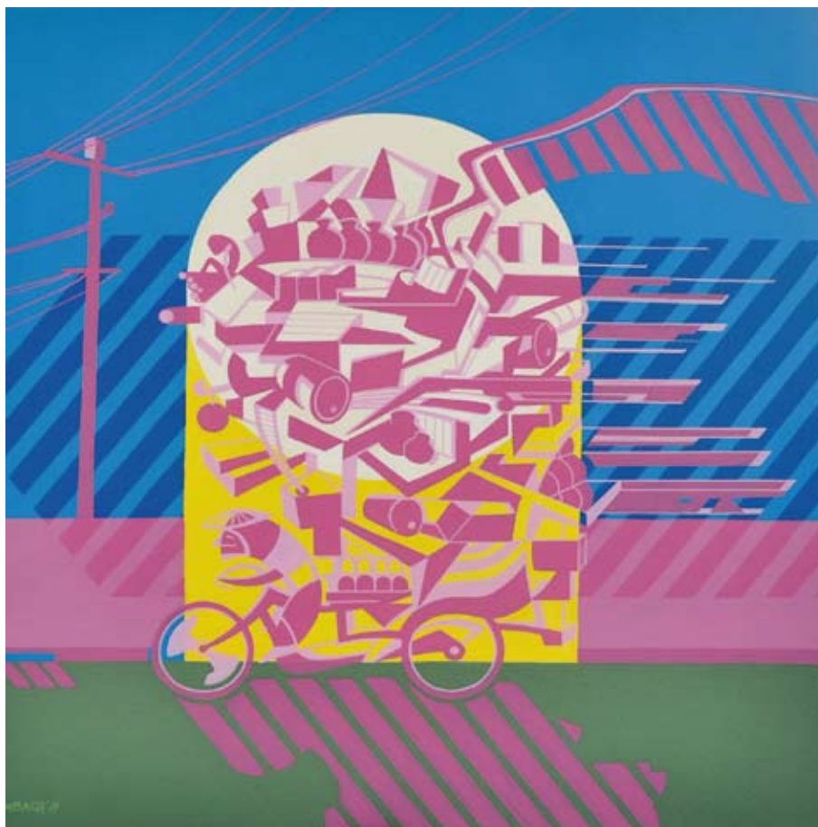
It's moving / 2011 / Acrílico mixta 100 x 100 cm. MARCO BOMBACH