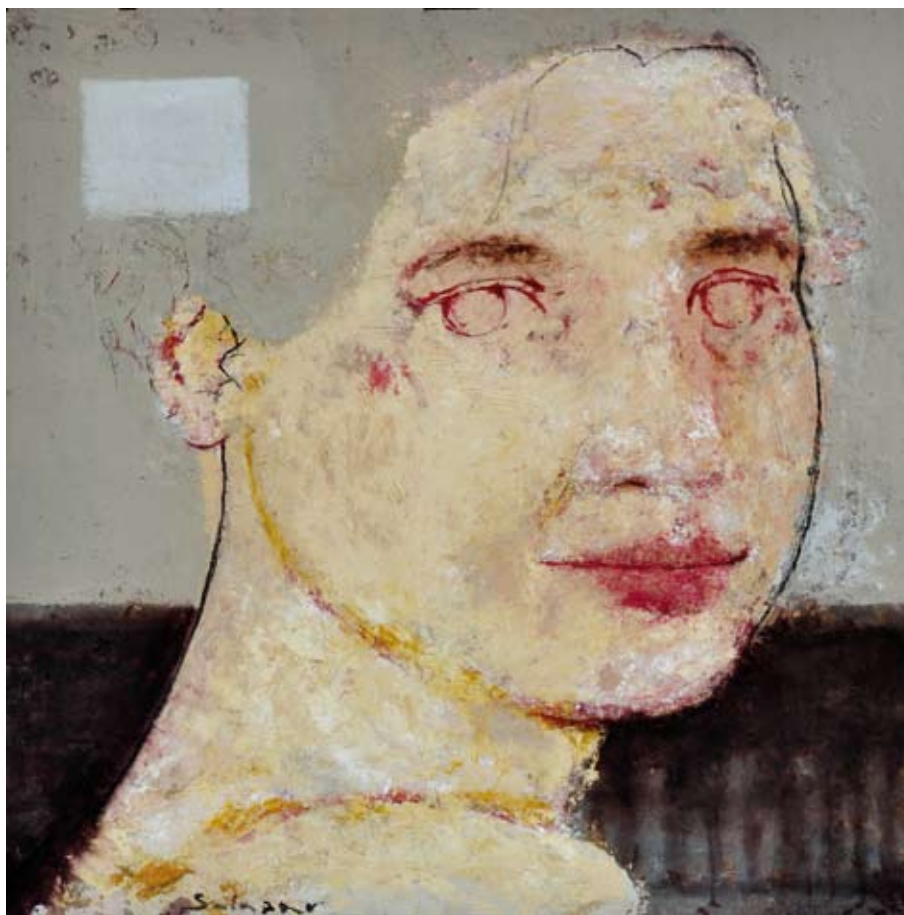
Rosario / 2011 / Mixta sobre madera 100 x 100 cm. EDUARDO SALAZAR SÁNCHEZ