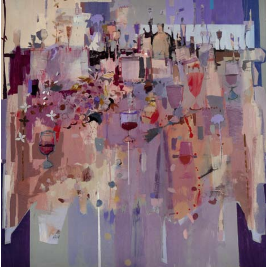
Caldos de la Axarquía / 2011 / Mixta sobre tabla 100 x 100 cm. FRANCHO MEDIALDEA