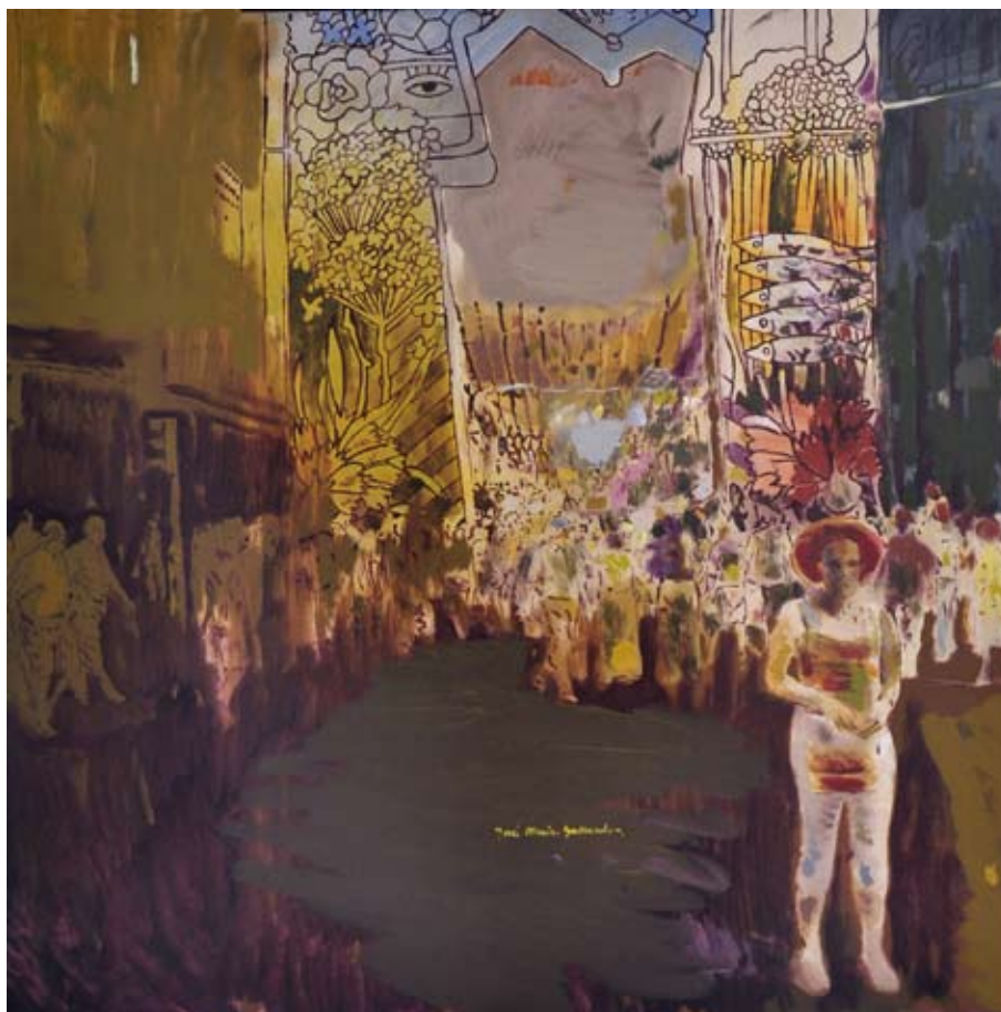
El aniversario / 2011 / Óleo sobre tela 100 x 100 cm. JOSÉ M º GALLARDO GASP