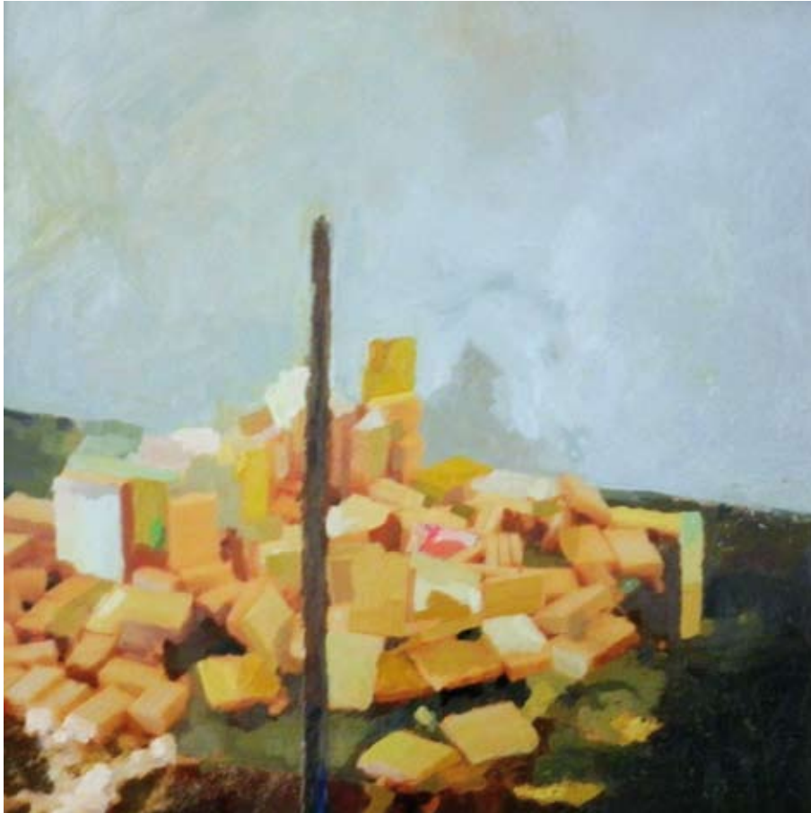
Change / 2011 / Óleo sobre tela encolada 100 x 100 cm. JOSÉ MANUEL ALBARRÁN PINO