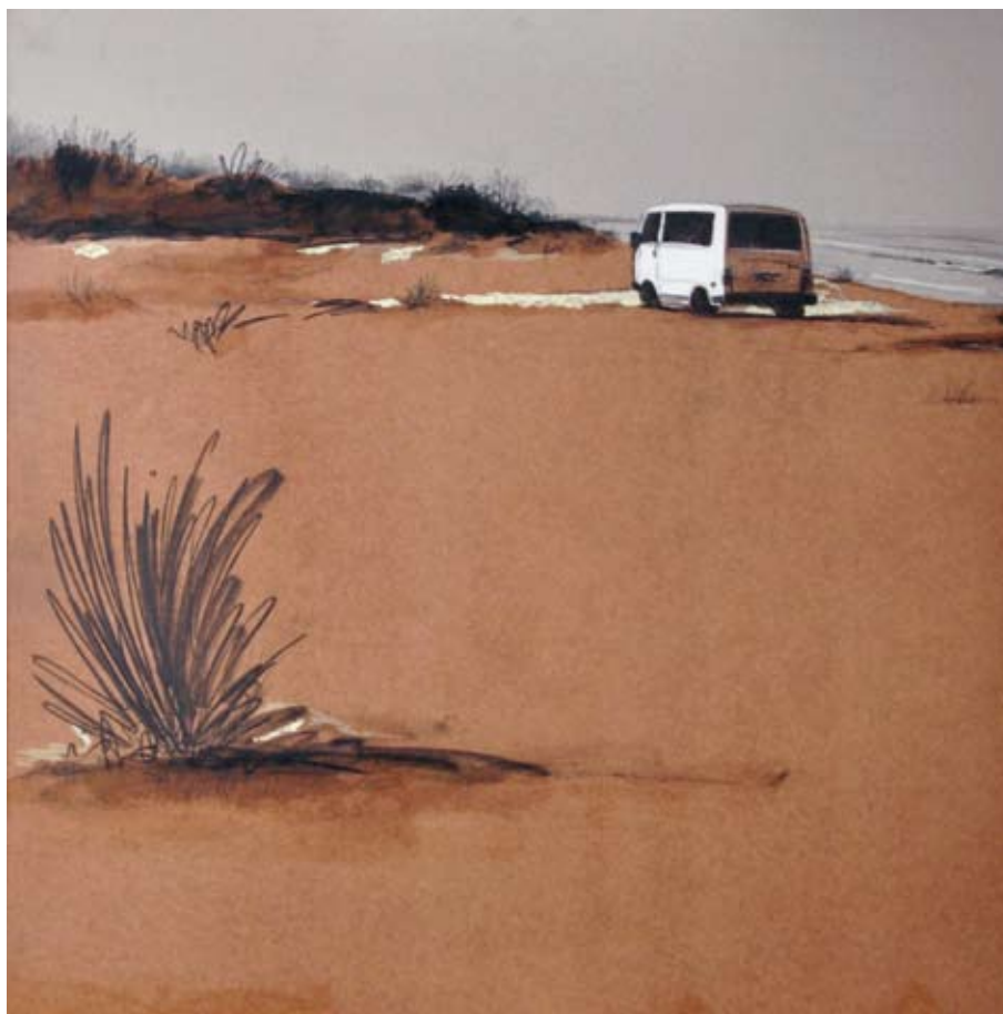
Nómadas III / 2011 / Collage, grafito, barniz mixta sobre DM 100 x 100 cm. EDUARDO GÓMEZ QUERY