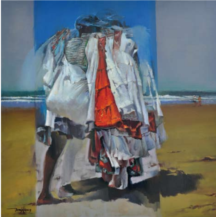
Sunday morning / 2011 / Óleo sobre lienzo 100 x 100 cm. TOMÁS LÓPEZ PEREA