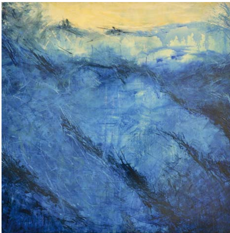
Marina III / 2011 / Acrílico sobre lienzo 100 x 100 cm. MARÍA SOLEDAD MORENO ORTA