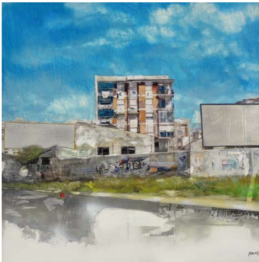
Publicitando crisis / 2011 / Mixta sobre tabla 100 x 100 cm. FRANCISCO JOSÉ PARRA PALOMO