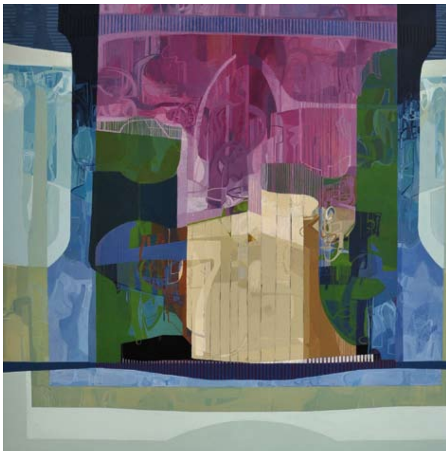
The End of the Means / 2011 / Acrílico sobre lienzo 100 x 100 cm. RUI TAVARES