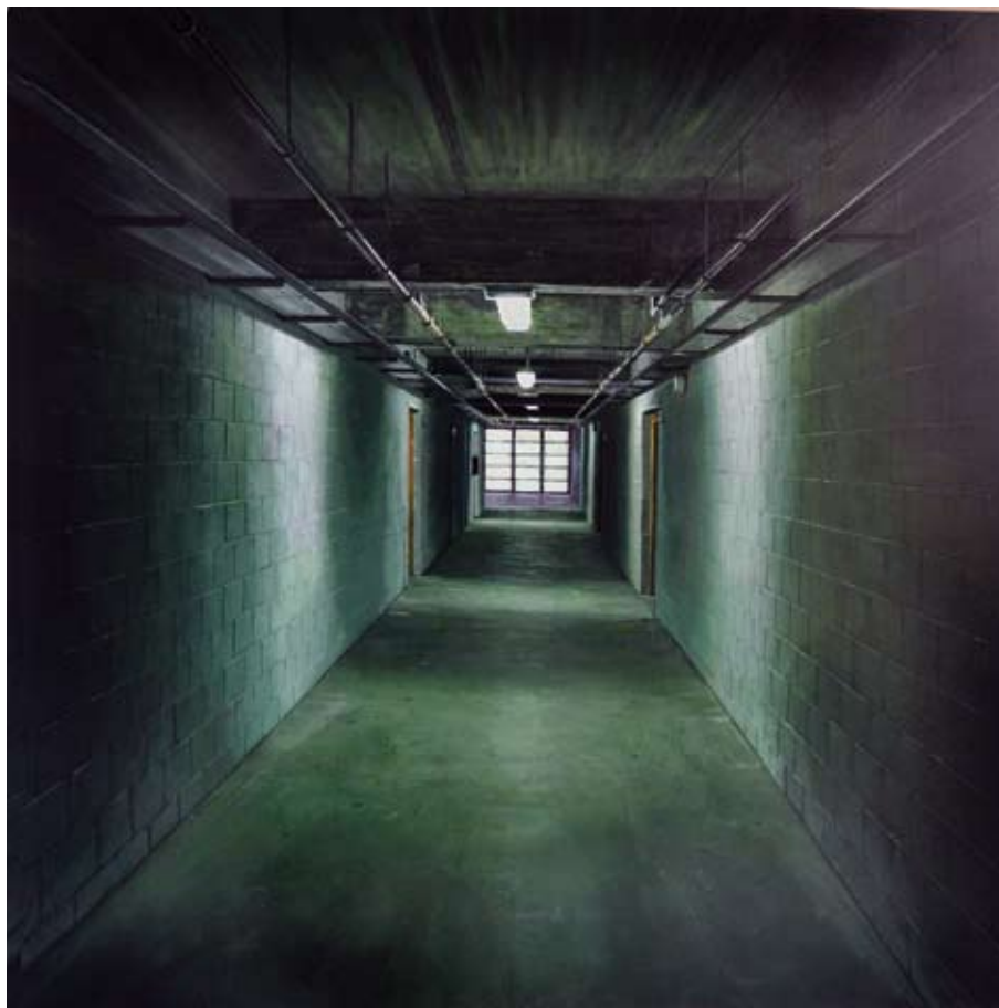
Al final del túnel / 2011 / Mixta sobre tabla 100 x 100 cm. DAVID MARTÍNEZ CALDERÓN