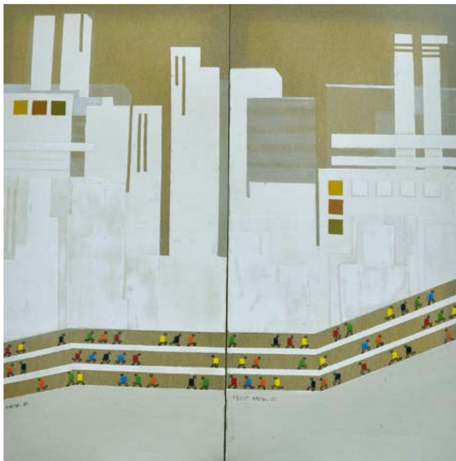
Transito / Mixta sobre lienzo 100 x 100 cm. MAYTE SANTOLARIA