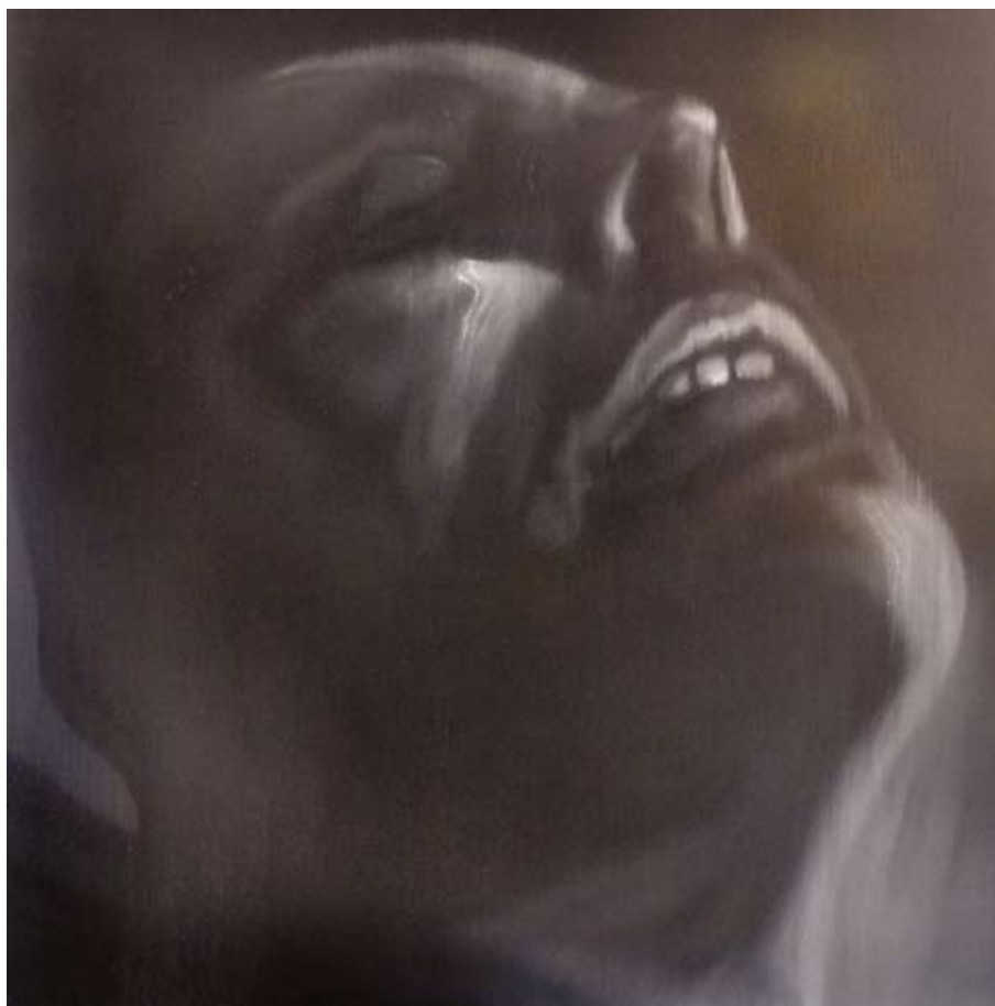
Self portrait / 2011 / Óleo sobre lienzo 100 x 100 cm. MARCELLO MAGNATO