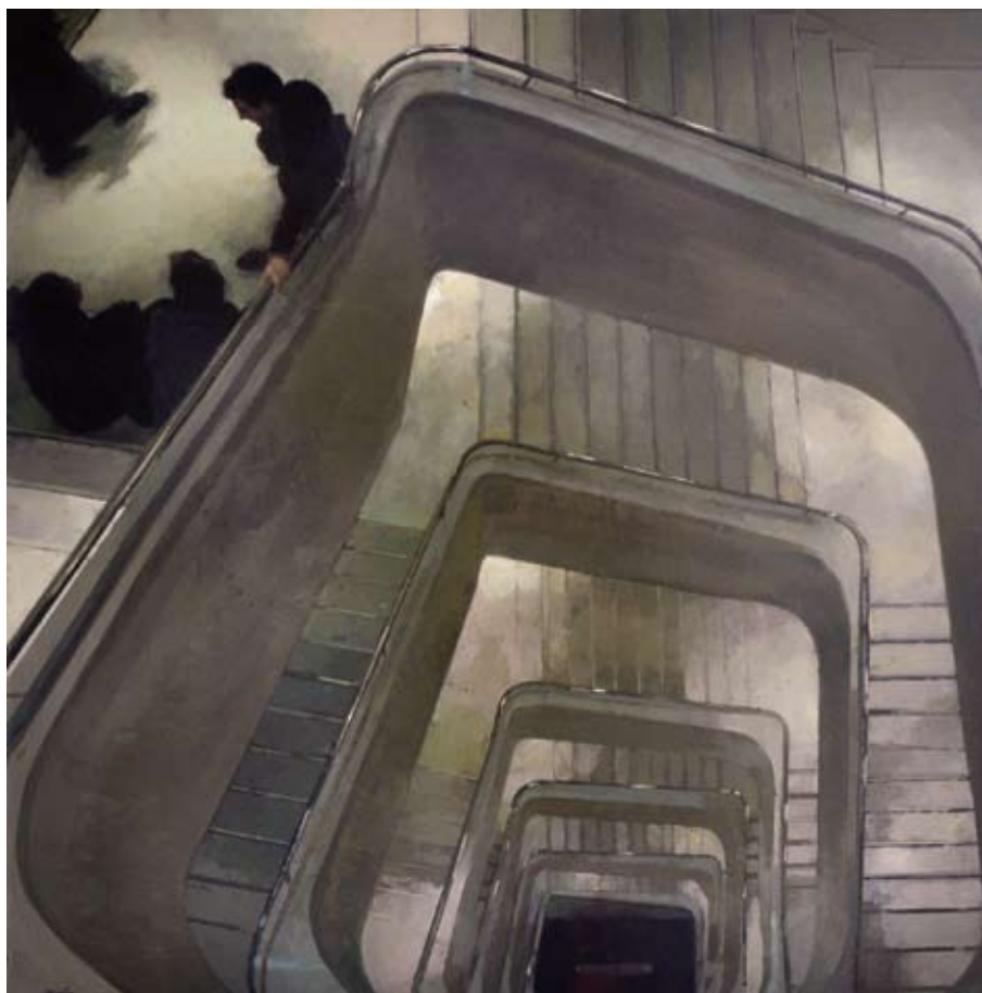
Paisaje interior, C.58 / 2011 / Mixta sobre lienzo 100 x 100 cm. FRANCISCO ESCALERA GONZÁLEZ