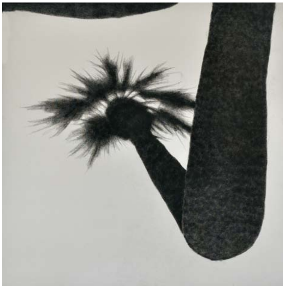
Sol y Sombra de Andalucía / 2011 / Pierre Noire sobre tela 100 x 100 cm. MAARTEN BINNENDIJK