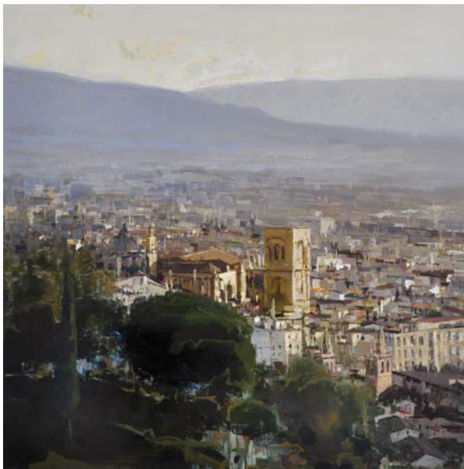
Atardecer en Granada / 2011 / Óleo sobre madera 100 x 100 cm. ANTONIO CANTERO TAPIA