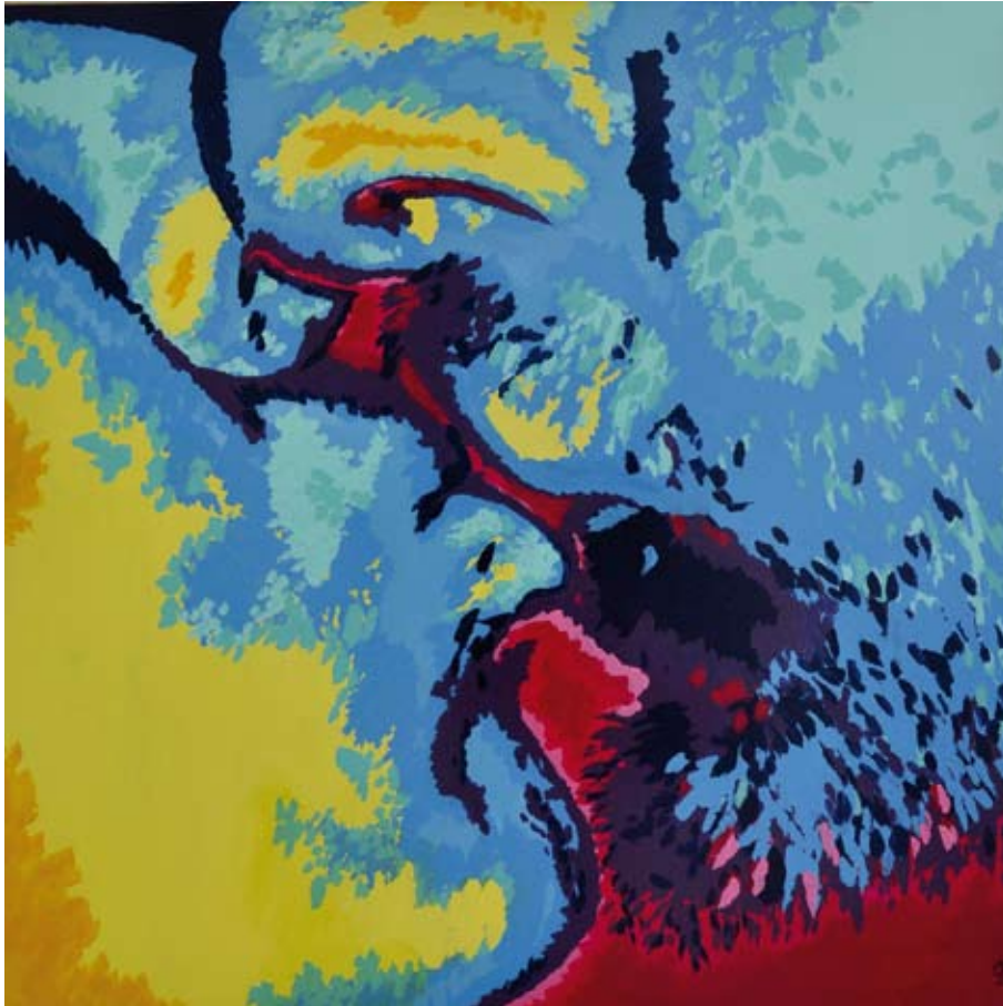
El beso / 2011 / Acrílico sobre tabla 100 x 100 cm. INMACULADA FERNANDEZ NAVAS