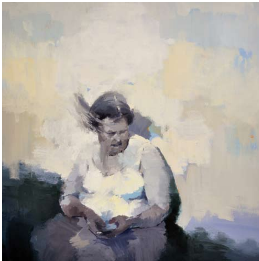
Vezes inestable / 2011 / Mixta sobre lienzo 100 x 100 cm. LUIS MANUEL CAPITÁN MINGUET