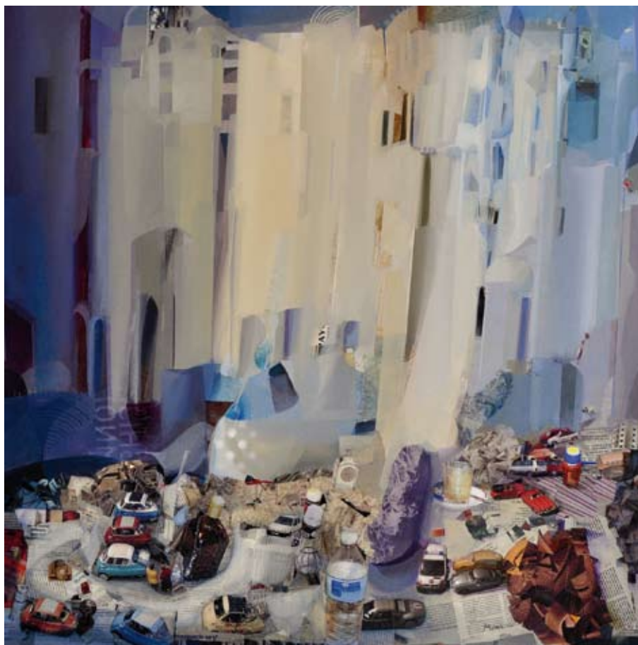
Plaza velada / 2011 / Collage, mixto sobre tabla 100 x 100 cm. JUAN CARLOS PORRAS FUNES