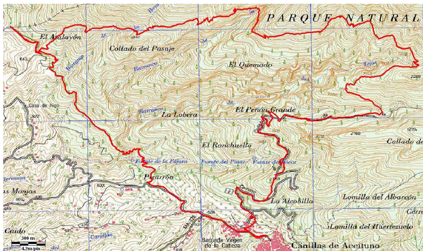
PLANO TOPOGRÁFICO (en rojo el track de la ruta que realizaremos)

PISCINA CUBIERTA TORRE DEL MAR: Telf. 607492169 PISCINA CUBIERTA VÉLEZ MÁLAGA: Telf. 663990197