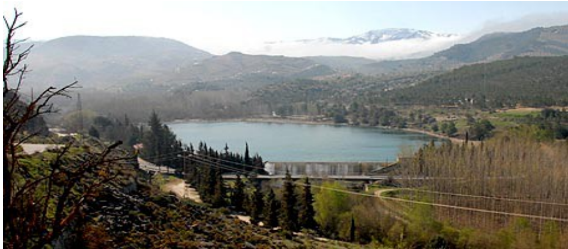
Pantaneta de Alhama de Granada Alhama de Granada y sus Tajos