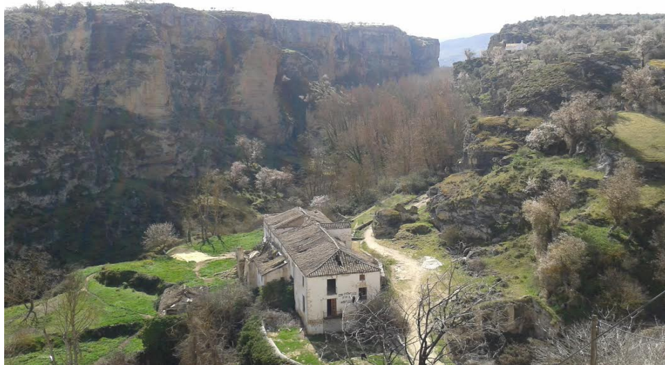
Paisaje de los Tajos, desde Alhama de Granada