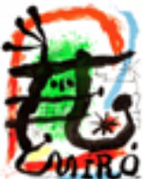
JOAN MIRÓ - 90 ANNIVERSAIRE GALERIE MAEGHT 1983 litografía en color 65 x 45