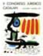
II CONGRESO JURÍDICO CATALÁN 1971 offset en color 77 x 57