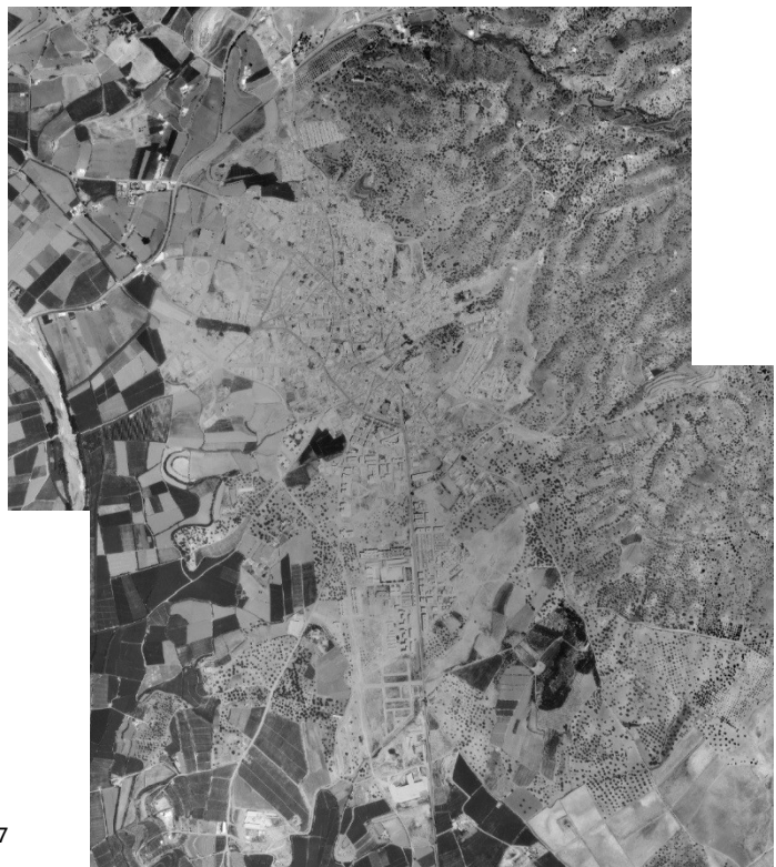
IMÁGENES AÉREAS DE VÉLEZ-MÁLAGA EN 1.956 Y 1.977

Hacia mediados del siglo XIX, Vélez Málaga y su comarca registra un cierto resurgir económico tras la crisis de inicios del siglo propiciado por la Guerra de la Independencia, que se traducirá en un notable crecimiento demográfico. Pero esta expansión se vio frenada en