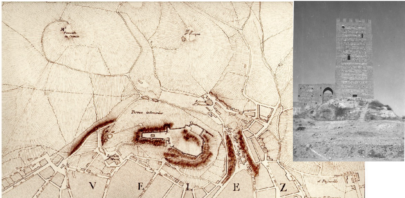
PLANO DE LA FORTALEZA REALIZADO POR LAS TROPAS FRANCESAS (1.811)

La ciudad de Vélez Málaga se funda en el siglo X, teniendo como núcleo originario su alcazaba (Fortaleza) y su contexto inmediato. Las características topográficas del enclave y la posterior evolución urbana, con una orografía muy accidentada, manifiestan cómo la finalidad militar fue fundamental, subordinando cualquier otro aspecto del asentamiento.