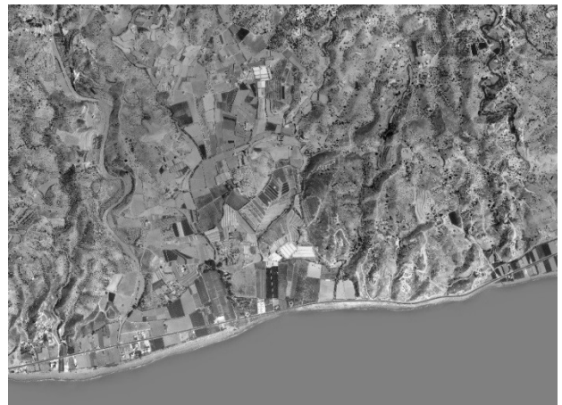
IMÁGENES AÉREAS DE BENAJARAFE-VALLENIZA Y ALMAYATE EN 1.956 Y 1.977

El caso más destacado es el de Torre del Mar, que había surgido a finales de la Edad Media como un pequeño centro defensivo (torre-castillo) y que a partir de la conquista castellana, en 1.487, irá adquiriendo importancia como centro de exportación de los productos agrícolas de la comarca (pasas, vinos, cítricos, etc.). Hasta los inicios del siglo XX estaba conformado por cuatro Barrios, el de la Parroquia, la Viña, las Casas Nuevas y el Castillo. Con la construcción en 1.896 de la carretera Málaga-Almería, se llegó a determinar