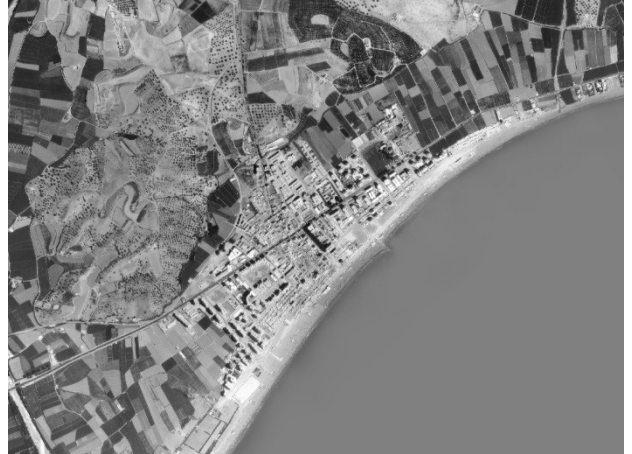
IMÁGENES AÉREAS DE TORRE DEL MAR EN 1.956 Y 1.977

Caso parecido, pero menos excepcional, será el que registren Chilches, Benajárfes, Valle-Niza, Almayate y Caleta, que eran pequeños núcleos urbanos ubicados a escasa distancia de la costa y vertebrados por el trazado de la carretera litoral Málaga-Almería o N-340. Si bien en un principio su singularidad edificatoria venía definida por viviendas unifamiliares de tipo “casamata”, con el paso del tiempo estas han evolucionado hacia pequeños bloques de viviendas plurifamiliares sin ningún tipo de organización o tipología arquitectónica. En los últimos años han proliferado las urbanizaciones, ocupadas en un buen número por extranjeros.