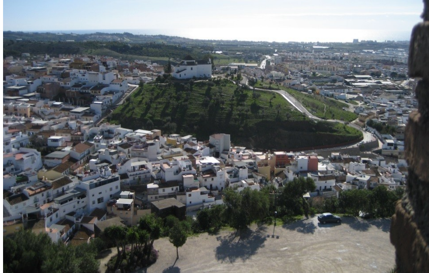
IMAGEN DEL CERRO DE LOS REMEDIOS DESDE LA FORTALEZA

espacio urbano significó asimismo la construcción o recuperación de ermitas y otros lugares de culto que a veces apenas si eran más que un pequeño altar o una hornacina en la pared, destacando la creación de la Ermita de la Virgen de los Remedios (1.649) en el cerro gemelo a la Alcazaba- Fortaleza.