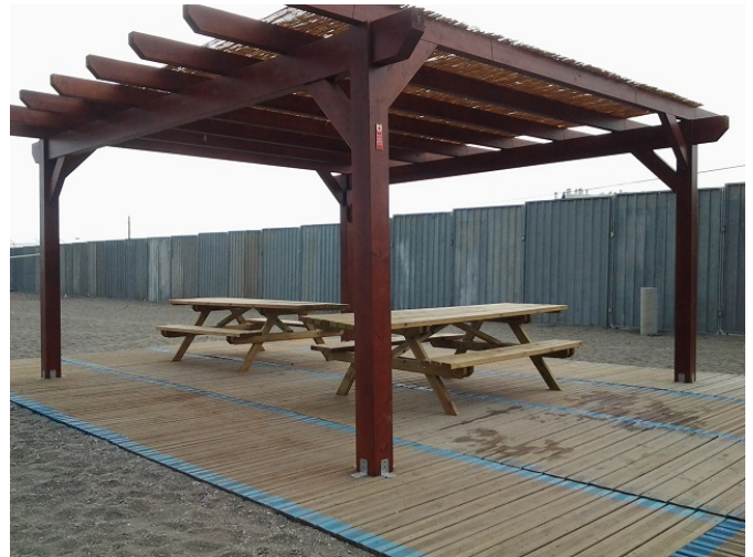
Zona de descanso