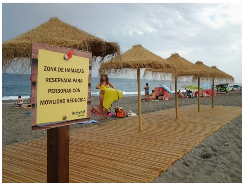
Zona reservada de sombra

Dirección: Supt-12 ( nuevo ensanche de Torre del Mar)