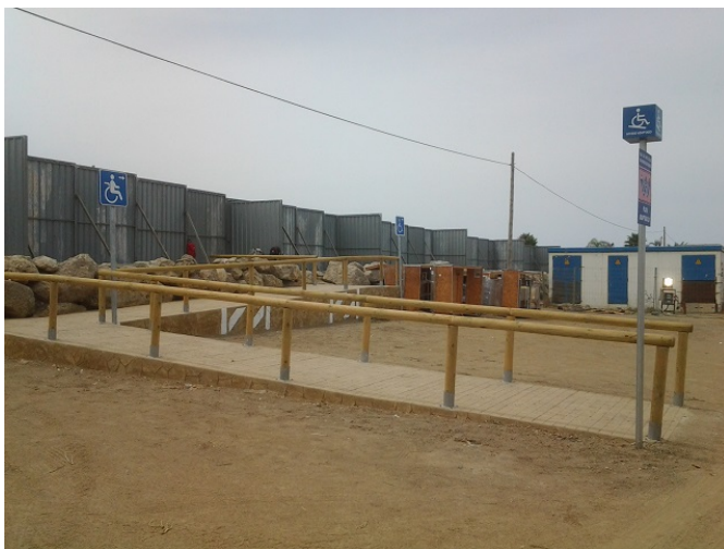
Rampa de acceso desde el aparcamiento.