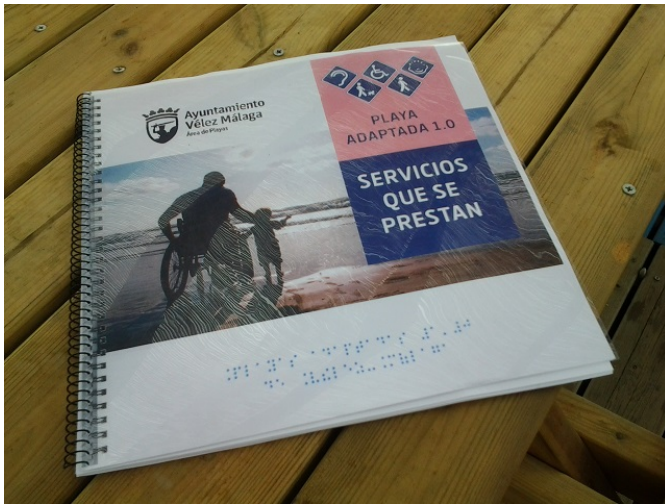
Información de los servicios en braille