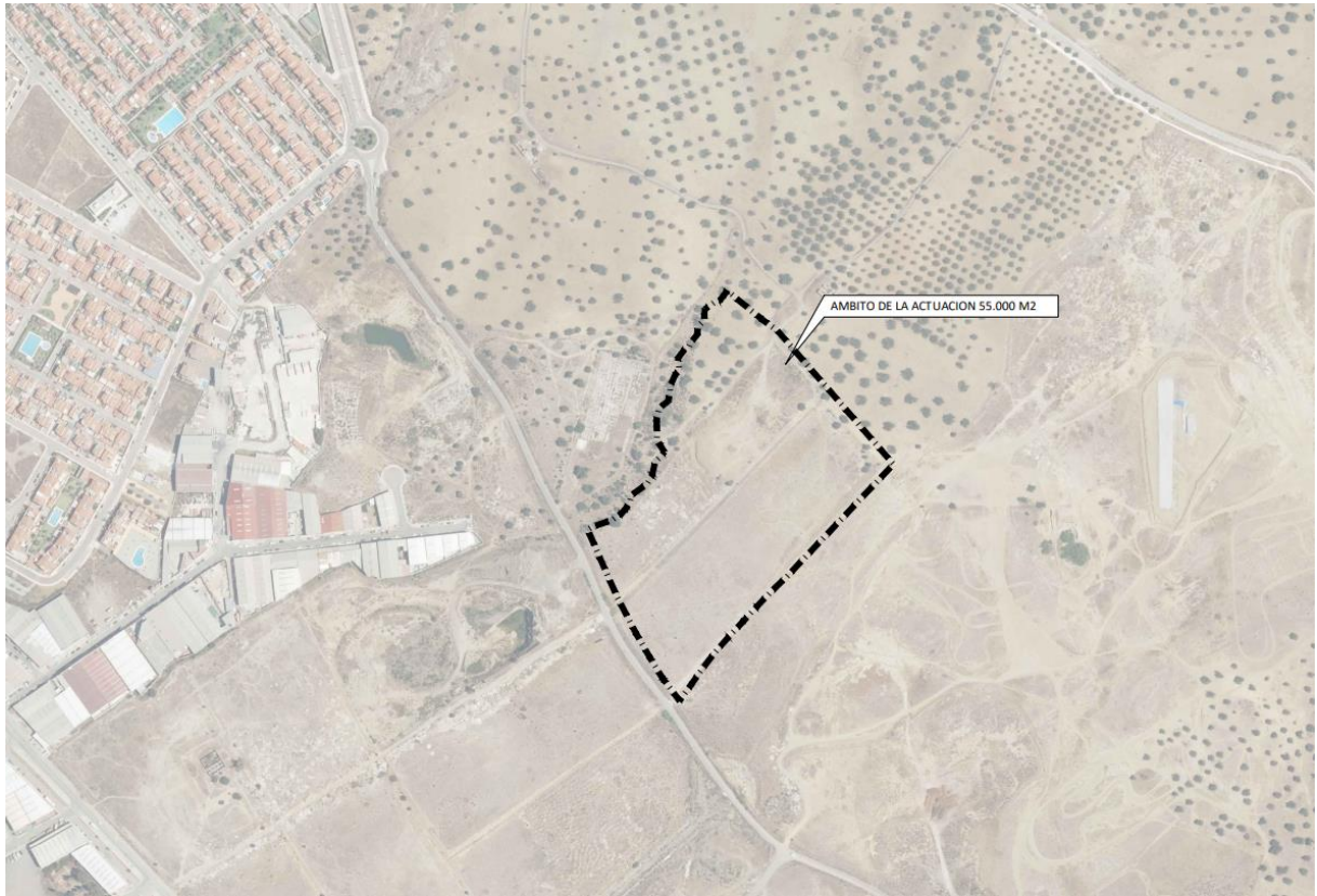
Ámbito de la actuación.