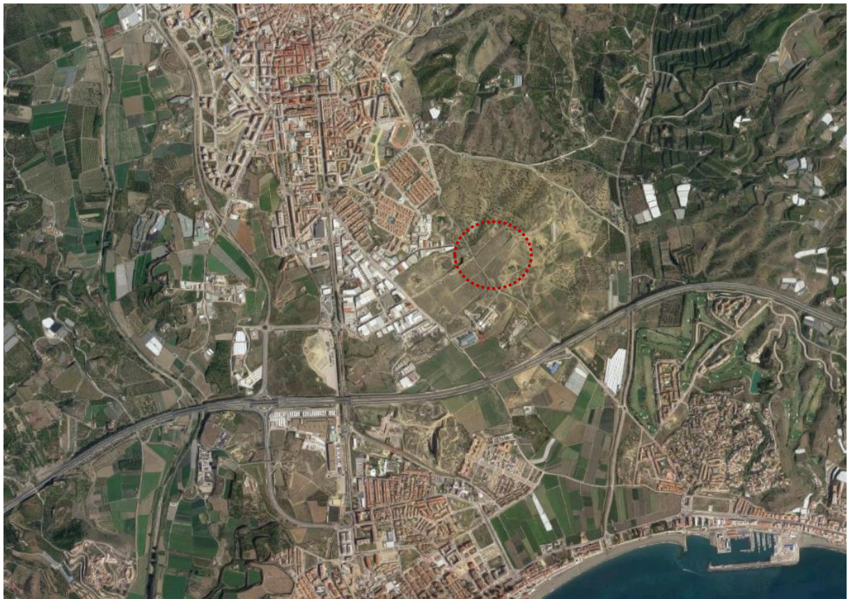
Situación de los terrenos en el término municipal.

Los terrenos sobre los que se sitúa la actuación se encuentran en el núcleo de Vélez-Málaga, dentro del término municipal del mismo nombre. Se encuentran al sureste de la localidad, por encima de la Autovía A-7.