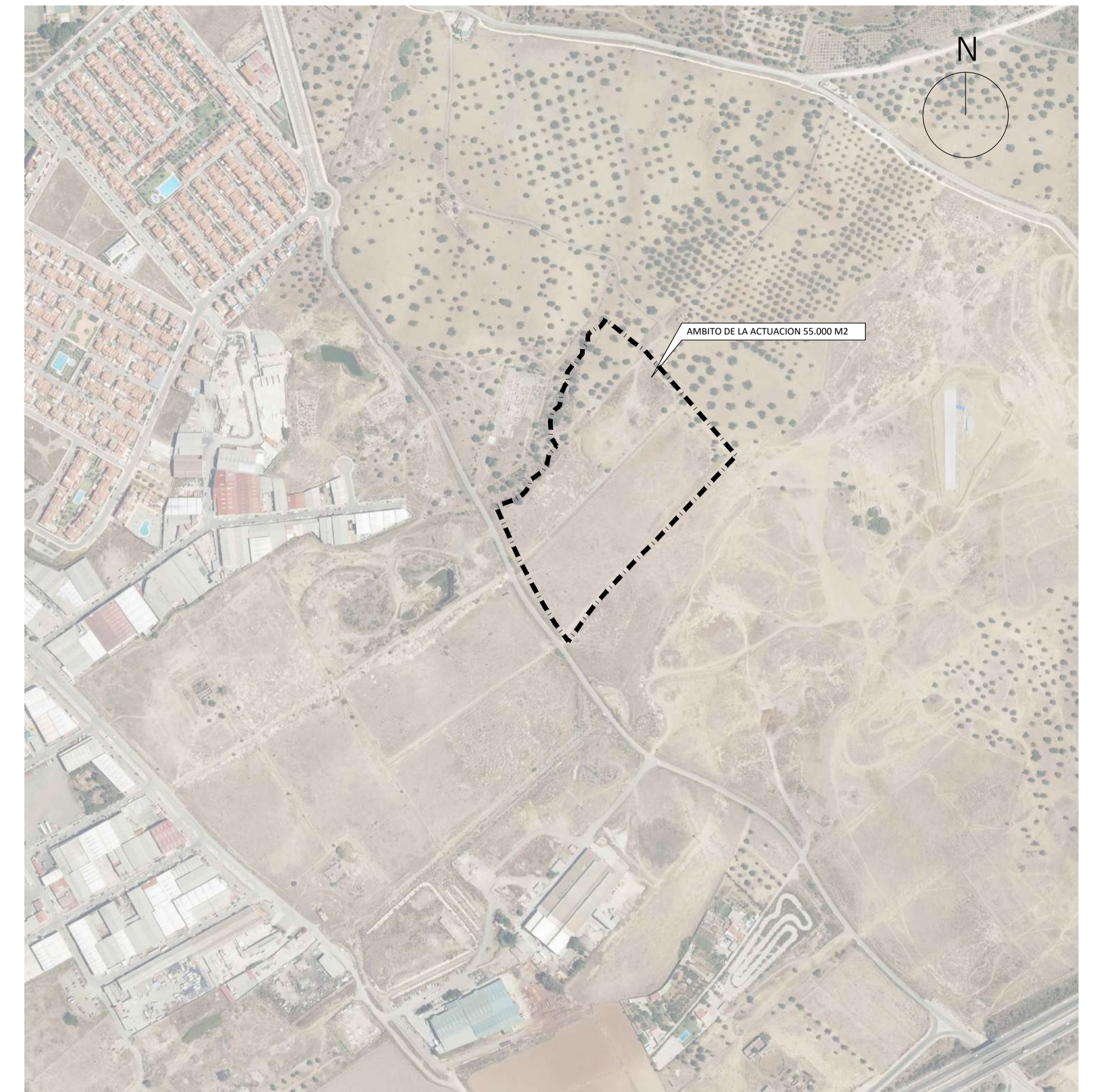
ESQUEMA DE LOCALIZACION