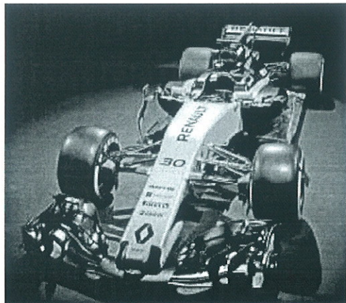
El RS 17 de Renault, presentado ayer en Londres.

• La marca presenta su bólido con el deseo de dar un salto de calidad